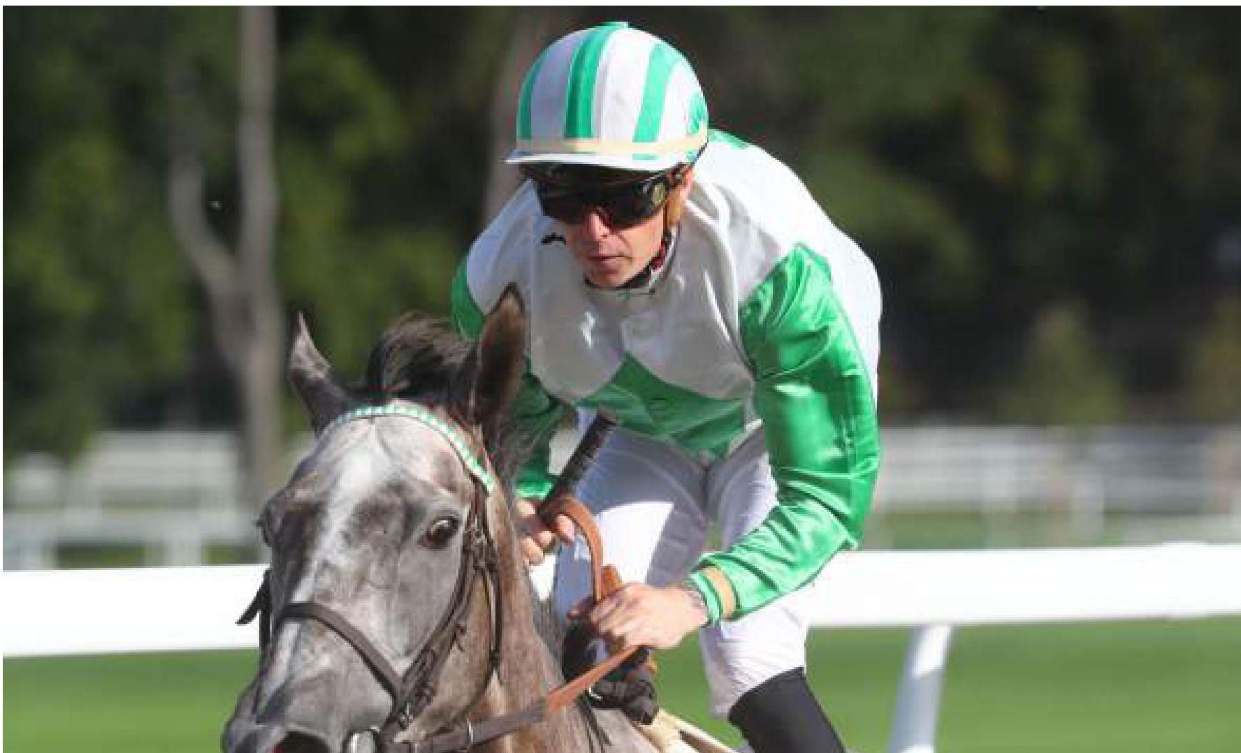
10 GALOPEURS À SUIVRE

Une mine d'or de chevaux repérés au trot et au galop, qui devraient faire mouche dans les jours à venir